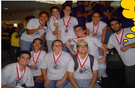
Segundo Lugar en los "Goofy Games" para los estudiantes de química.